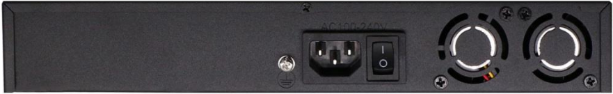
Рис.2 Коммутатор SW-61621(300W) (вид сзади)