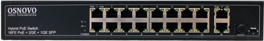
Рис.1 Коммутатор SW-61621(300W) (вид спереди)